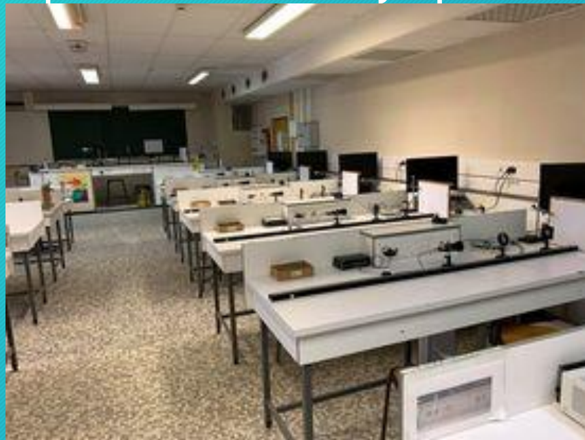
Deux salles dédiées aux activités expérimentales de Physique