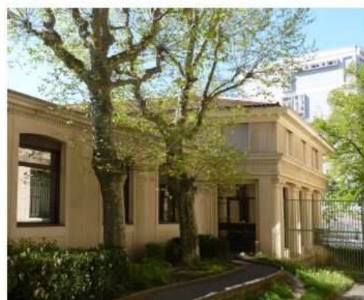
Restaurant du lycée

Se loger à Saint-Étienne est particulièrement facile : c'est la ville étudiante la moins chère de France, avec un loyer mensuel médian de 320 € pour un studio. Le lycée met régulièrement en ligne ( http://www.fauriel.org/logement/ ) des offres de logements privés à proximité.