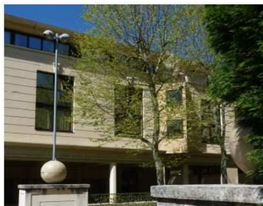
Le bâtiment de l'internat réservé aux CPGE

La solution préférée de nos étudiants qui ne peuvent pas bénéficier d'une chambre en internat est le statut d'interne externe (accordé sur simple demande) : logés dans une chambre ou un appartement en ville (loué dans le parc privé), les internes externes peuvent prendre tous leurs repas au lycée et accèdent aux salles de travail des internes.